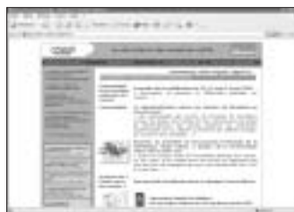
Site interne des membres actifs

• Restructuration de la rubrique « Au service de l'action sociale » où vous retrouverez des événements en Santé mentale ; des formations professionnelles continues liées à ce domaine ; des publications spécifiques et la revue Vie Sociale et Traitements .