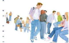
Illustration de Patrice Roerke